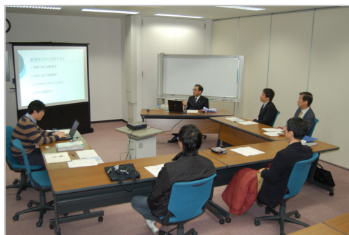
由井コロキウム風景