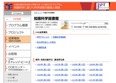
本COEサイト「知識科学図書館」