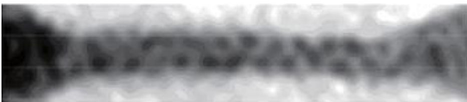
原子スケールで細い金線の透過型電子顕微鏡像 (黒い斑点がほぼ原子に対応する)

時として、原子たちは我々が予想もしないような規則で並んだり、動いたりします。まだまだ分からないことが多い原子たちの世界を楽しんで頂きたと思います。