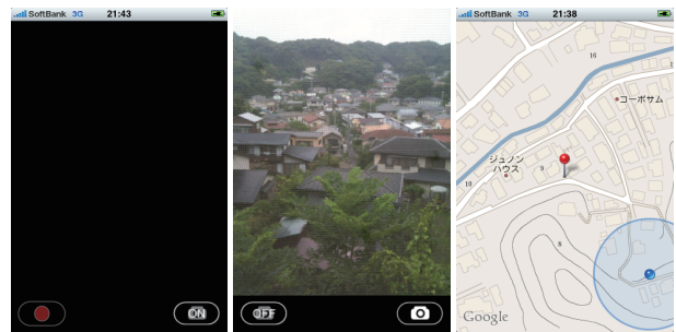
図3: 左: 通常画面 中央: 撮影画面 右: 地図画面.

に対象音声ファイル名とステップ検出フラグの値と録音開始からの経過時間を入力する。