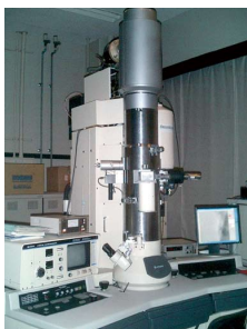
透過型電子顕微鏡(TEM)