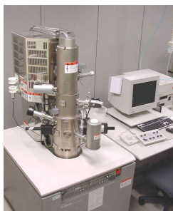
走査型電子顕微鏡(SEM)