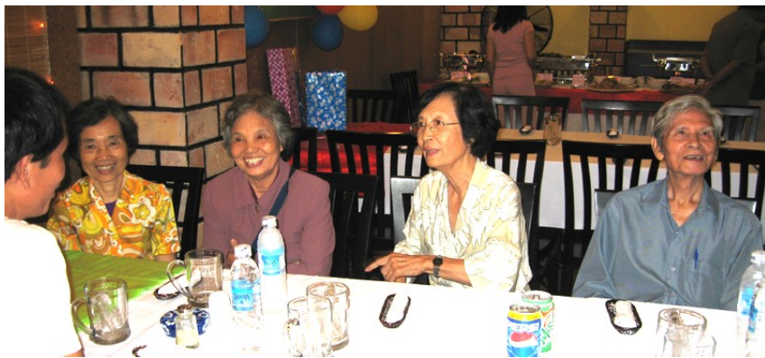
Học sinh chuyên Toán gặp các thầy cô ngày 26/11/2006