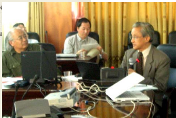
Japan-Vietnam data mining workshop Hanoi 12.2004

8 July 1993 from Institute of Information Technology in Hanoi, Visiting Associate Professor