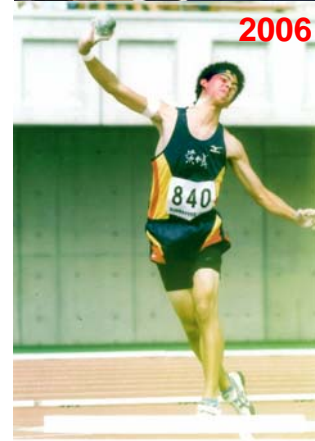
第33回 関東中学校陸上競技大会