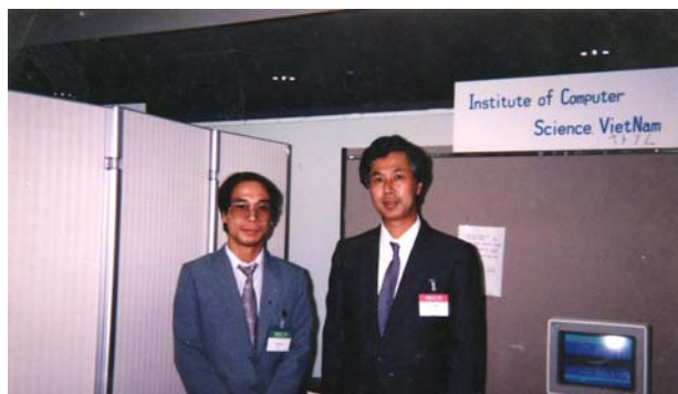
1 st PRICAI, Nagoya, 11.1990