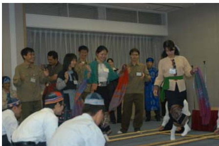
Vietnamese dance and songs