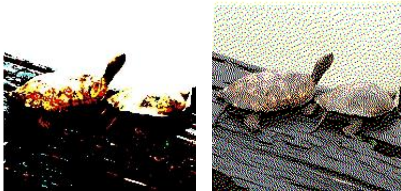
図 1: 画像出力. 単純 2 値化法と誤差拡散法の出力.

とである．誤差伝播法ではラスタ順に画像を走査するが、なぜラスタ順なのだろう？平均濃淡レベルを保つことは分かっているが、何かの基準で最適なものを求めようとしているのだろうか？計算時間についてはどうだろう？疑り深いと言えれば聞こえが悪いが、子供のように”なぜ？”の疑問を発するところから研究は始まるのである．