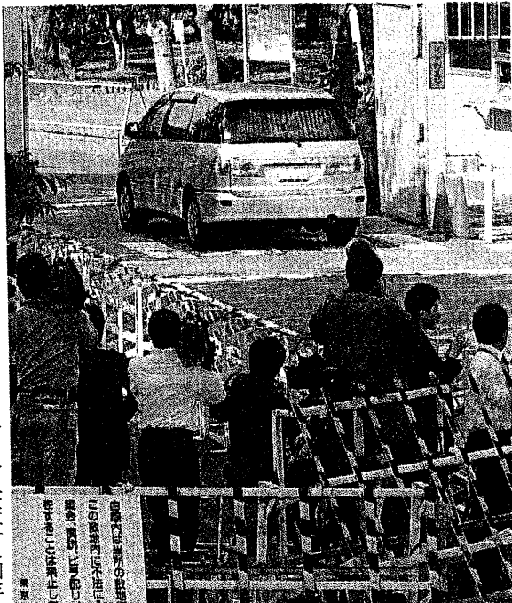
事件談合工事の入り鉄鋼 で、東京拘置所に入る容疑者を 乗せたとみられる車—26日午後

ま四月に退院 科矯正のため 大館市の総合 の痛みの原因 回旋位固定」 断され、翌八 などの手術を は改善したも は運動障害が も通院治療 る。 男児側は訴 書