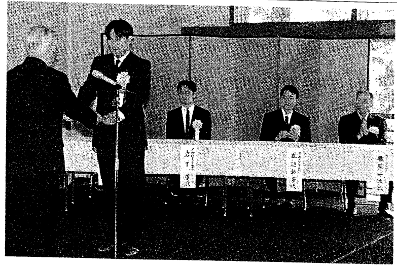
山 下 太 郎 郎 頭 彰 育 英 会