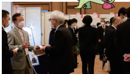
Matching HUB Hokuriku 2021 (2021年11月11日・12日)