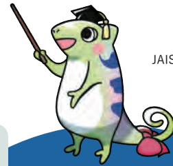
JAISTマスコットキャラクター ジャイレオン

各国立大学法人が6年間で達成すべき目標を明示したものを「中期目標」、中期目標を実現させるための具体的な計画を「中期計画」と言います。