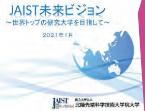
JAIST 未来ビジョン（2021年1月策定）

第3期中期目標期間最終年度である2021年度の年俸制適用者は87名（ 58.8% ）となり、数値目標（40%）を大幅に上回りました。