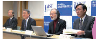
「研究科統合構想」の記者会見 (2015年3月6日)

2021年度には、新たに博士後期課程学生を対象とした「 価値創造実践プログラム 」を創設しました。本プログラムでは、日米欧の国際的な大学ネットワークを活用した「 グローバル課題解決型学習 」を通じて価値創造方法の習得・開発・実践を行うこととしており、東京社会人コースの博士後期課程学生の国際共同研究能力を高めることで国際的に通用する 未来価値創造人材 を育成することを目指しています（2022年度から開講）。