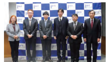
「Jイノベーションプラットフォーム型事業」 採択にかかる記者発表の様子

これらの取組の結果、2021年度の産学官連携に関する他機関との協議件数は2015年度の385件と比較して 約115%増 となる 827件 に達し、数値目標（50%増）を大幅に上回って達成しました。また、このうち6年間で 年間最大36件 の協議が共同研究契約等の締結に繋がりました。