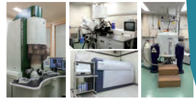
本学の最先端研究設備・機器

これらの取組の結果、2021年度の産学官連携に関する他機関との協議件数は2015年度の385件と比較して 約115%増 となる 827件 に達し、数値目標（50%増）を大幅に上回って達成しました。また、このうち6年間で 年間最大36件 の協議が共同研究契約等の締結に繋がりました。