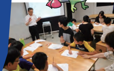
JAISTサイエンス&テクノロジー教室 (2019年8月3日)

金沢駅前オフィスのセミナーは年間30回程度開催され、2016～2019年度の4年間に地域の産業界や地元自治体から延べ 3,604名 が参加しました（2016年度 359名、2017年度 1,141名、2018年度 1,207名、2019年度 897名 ※2020～2021年度はオンラインを中心に開催）。2021年度に開講した「北陸観光コア人材育成スクール」では 全19回 の講義を開講し、受講生 15名 が修了しました。