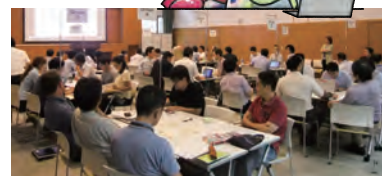
F Dにおけるグループワークの様子 (2019年9月9日)

2017年度以降毎年度、教員のF D参加率は数値目標の 100% を達成しました。これらのF D活動は、講義の収録・学内公開の全学的な実施など、教育方法の組織的改善・充実に効果を挙げています。