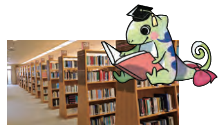
専門的・先端的な学術資料を 配架する附属図書館