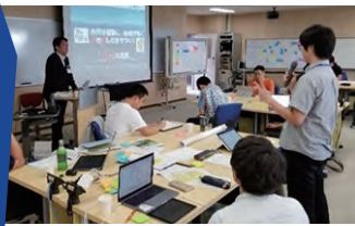
能美市×IoT/AIブートキャンプ (2018年9月25～28日)