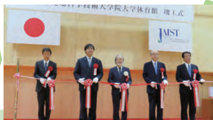
体育館竣工式（2018年12月14日）