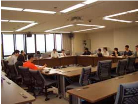
毎月の RA ミーティングの様子