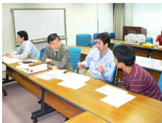
グループワークを実施