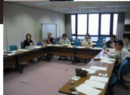
プレゼンテーション大会を実施