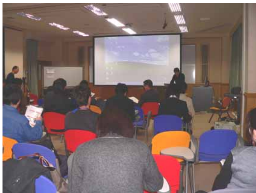
研究成果を発表する RA