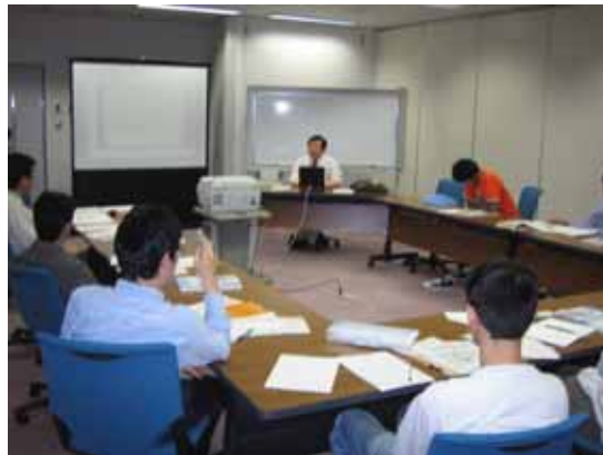
現場で必要なコーディネーション力について意見交換