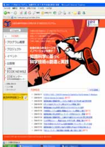
科学技術開発戦略センターサイト