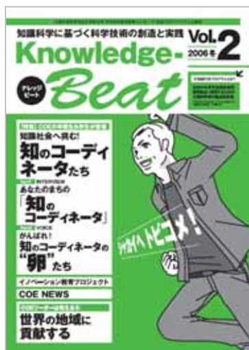
広報誌「ナレッジビート」

RAプロジェクトの活動については、広報誌「ナレッジ・ビート」及び本COEホームページを通じて公開した。