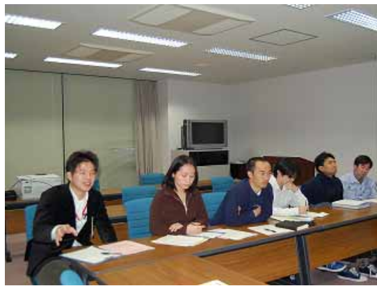
知のコーディネータの“卵”から活発な質問が出る