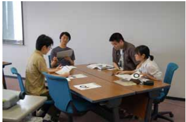
グループ別プレゼンテーション大会を実施