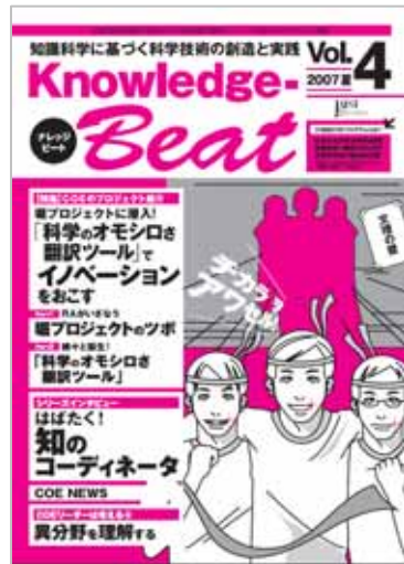
広報誌「ナレッジビート」

RAプロジェクトの活動については、昨年度同様に広報誌「ナレッジ・ビート」(全7号)及び本COEホームページを通じて公開した。