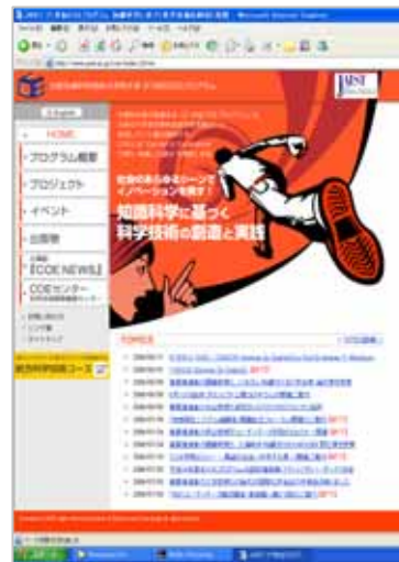
科学技術開発戦略センターサイト http://www.jaist.ac.jp/coe/indexJ2.htm 【英語版】 http://www.jaist.ac.jp/coe/