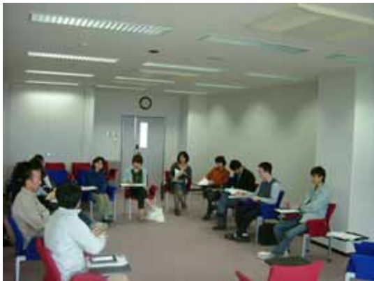
月1回の RA ミーティングの様子