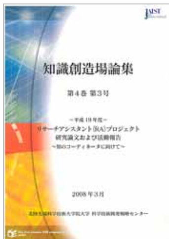
知識創造場論集 第4巻 第3号 (2008年3月刊)