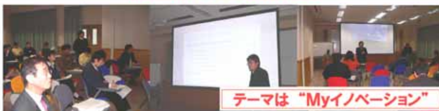
昨年度実施の様相