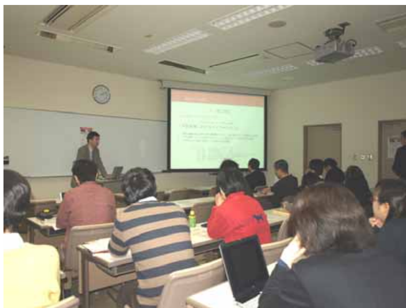
研究成果を発表する RA