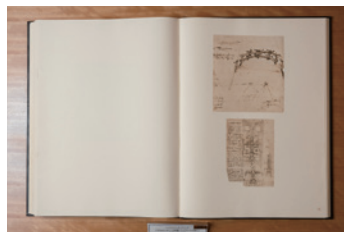
レオナルド・ダ・ヴィンチのアトランティコ手稿 (原本を忠実に再現した版)