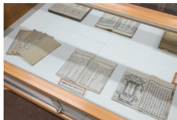
『解体新書』（1774年）初版本 訳：杉田玄白・前野良沢 初版本5冊1セットが揃っています。

先駆者たちの古典やメモ書きに接することにより、創造の原点に立ち戻ることができるという初代学長の想いから、数多くの貴重図書を常設展示しています。先人たちの足跡に触れてみませんか。