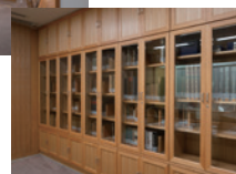
自然科学・哲学関係の 貴重図書約130タイトル