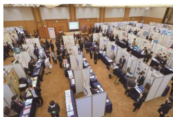
ブース展示会場の様子