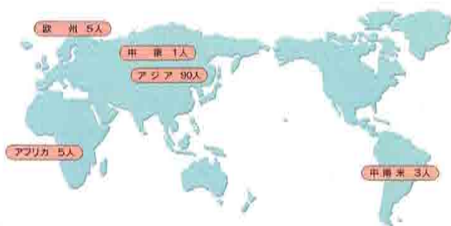
表3: 出身地域別留学生数