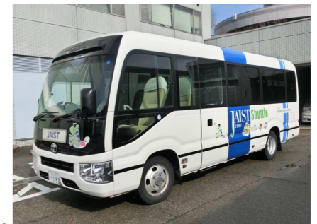
運行車両 Operating Vehicle

新幹線工事現場 Construction site of bullet train (Shinkansen)