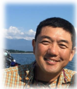
魚津水族館 前館長